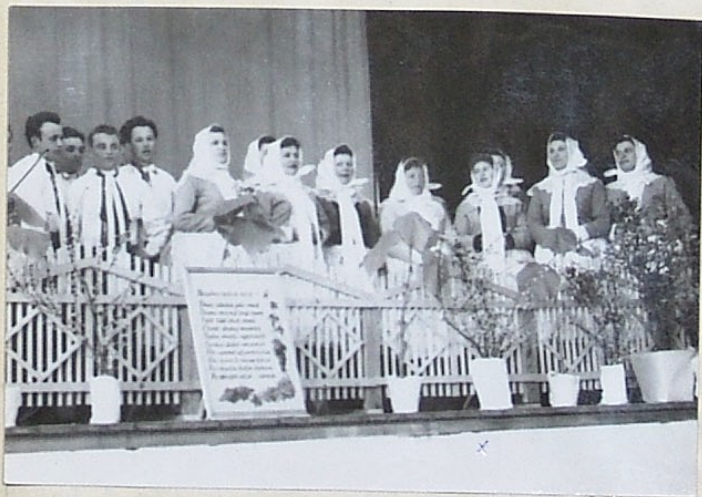
Zabavení virařské výstavy „Křížkem“

dospělých, 52 dětí a 79 zákyň. V ZTV 12 mužů, 11 žen, 18 dospělých, 23 dospělých, 32 děti a 52 zákyň, 24 funkce, 106 př. - 275 oddíl kopaní 111 členů " kůňkovi 35 " odhýni 12 sportovní gymnastika 24, 11 kůňkovi a 13 odhýni