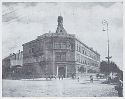
Státní reálné gymnasium v Hodoníně. Red. F. A. Slavík