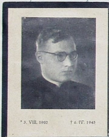
* 3. VIII. 1920 † 6. IV. 1945