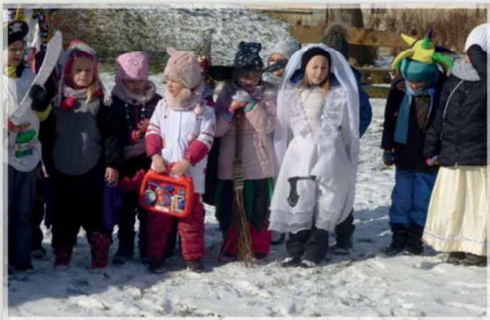
Fašank v MŠ