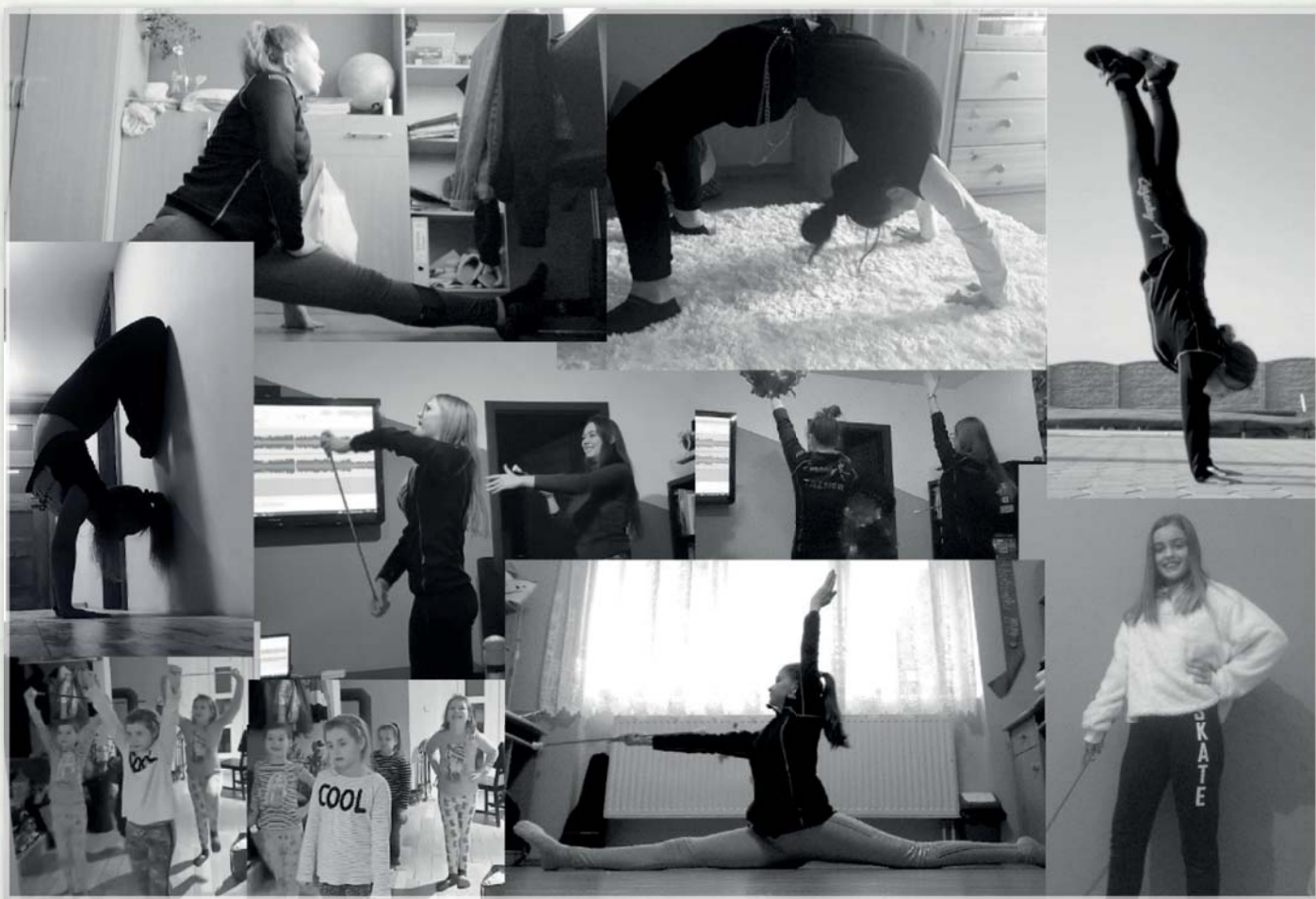
Mažoretky Zuzanky trénují v „lockdownu“ doma