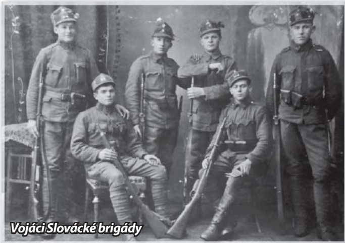
Vojáci Slovácké brigády

Jak to tenkrát všechno bylo, o co šlo? 28. října 1918 nemělo ještě vznikající Československo vlastní armádu, která by mohla zajistit hranice nového státu. Zvláště neklidná byla rakousko – moravská hranice. Začátky formování brigády začínají 28. října 1918. Národní výbor v Brně rozhodl založit brigádu v Hodoníně. 5 listopadu 1918 se v Hodoníně sešli v Besedním domě čeští důstojníci a založili Slováckou brigádu. Slovácká brigáda střežila řadu jihomoravských okresů: hodonínský, mikulovský, břeclavský, kyjovský, uherskohradištský a uherskobrodský. Členové brigády mimo jiné střežili také důležité železniční uzly a další strategické objekty. Hlavním a konečným cílem Slovácké brigády bylo vyhnání cizího vojska z československého území.