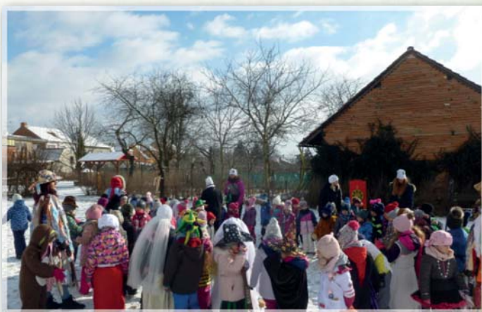
Fašank v MŠ