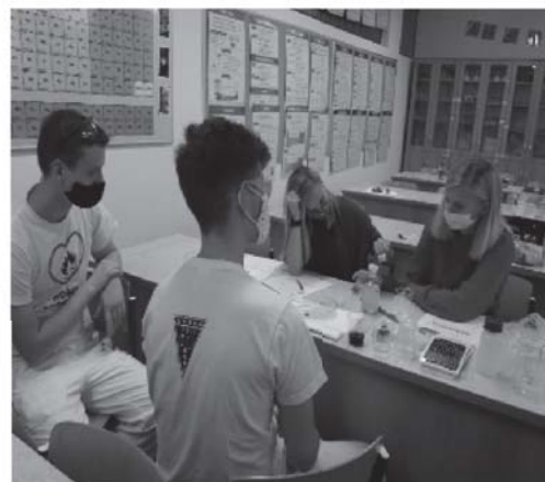
FOTO: Workshop chemických pokusů pro pedagogy ZŠ – září /2020

Ale v našem území jde především o děti cizinců, se sluchovým či tělesným hendikepem, talentované děti, u nichž je třeba hlavně řešit podpůrná opatření. Tím se myslí především podpora pedagogického a nepedagogického personálu. Další skupinou, kterou řešíme jsou rodiče, ale tady vnímáme jistou zdrženlivost, která vychází z individuálních problémů rodičů dětí ve vztahu ke škole.