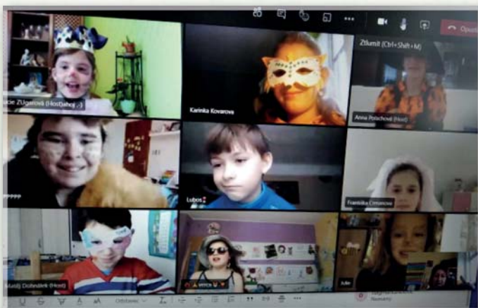
On-line výuka na ZŠ