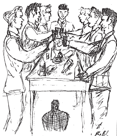
Po maturitě – 3.6.1954. Výmol před 65 lety

Šlo o osobnosti, bývali členy nejrůzněj- ších odborných společností, psávali do odborných časopisů, často publikovali i knihy. A na druhou stranu – jaká mají práva, co mohou od žáků a studentů po- žadovat. Proč to ministerstvo neřeší, kdo to má dělat? Škola a rodiče by měly mít jeden společný cíl – vychovávat vzdě- lané a slušné lidi. A začít se musí už od těch nejmenších, vést je k tomu, že život to nejsou jenom práva a požadavky, ale také povinnosti. Je nějaké řešení? Je, ale je to běh na dlouhou trať. V naší společ- nosti by zase mělo platit „Suum cuique“ – každému, co jeho jest. Tedy nejen prá- va, ale i povinnosti.