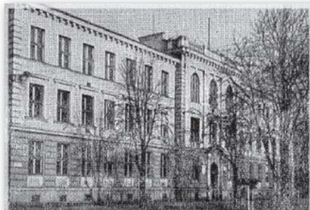
100 let gymnázia v Břeclavi (1919-2019), v řeči študentské gymplu neboli boudy.