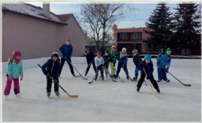
Kluziště na sokolském hřišti