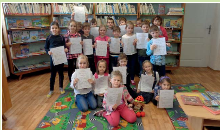
První vysvědčení dětí z 1. tříd