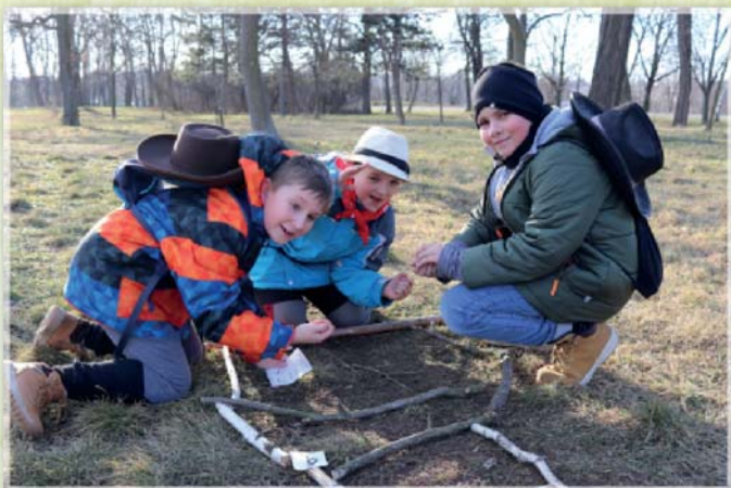
Děti z Hnutí Brontosaurus