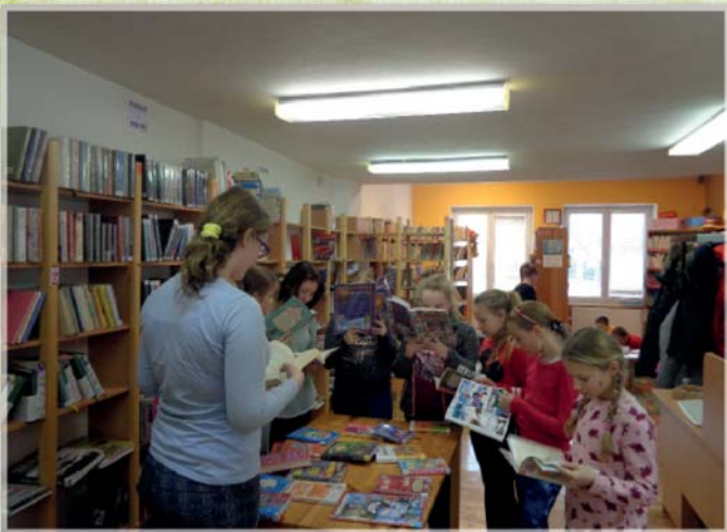
ZŠ v knihovně