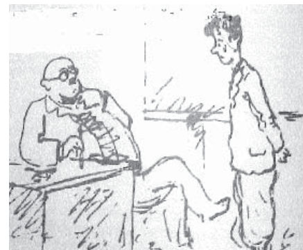
Povězte studente, povězte nám, co jsem já na dnešek uložil Vám?

Ale obraťme list. Sám jsem vlastně celý život prožil ve školních škamkách a posluchárnách (17 let) a dalších víc jak padesát let jako vysokoškolský učitel. A jako studenty nás tenkrát tyto problémy nezajímaly, ať byly režimy jakékoli. Život studentský (vita scholarum) byl vždycky ži- vot veselý. Vzpomeňme třeba jen Jirásko- vu Filozofskou historii (Jirásek ji napsal jako mladý litomyšlský gymnaziální profesor v roce 1878) nebo knihu Jaroslava Žáka Štu- dáci a kantoři, nebo sbírku Písně žáků da- rebáků, v níž se především ukazuje bídny