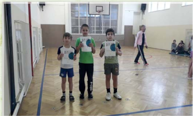
Školní soutěž ve šplhu