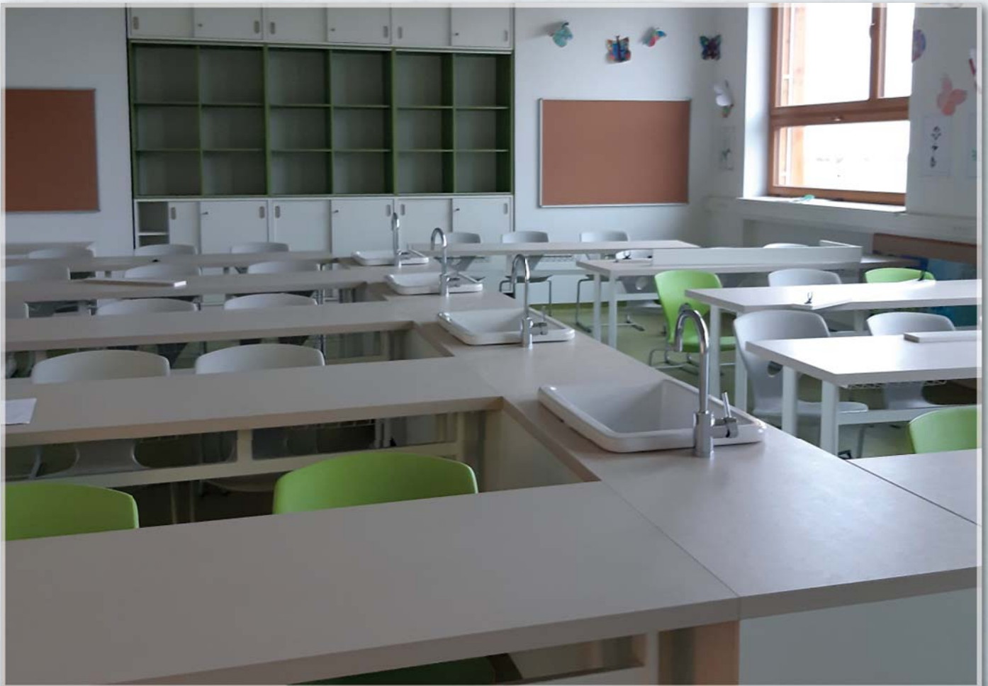
Nová učebna přírodopisu v přístavbě „měšťanky“