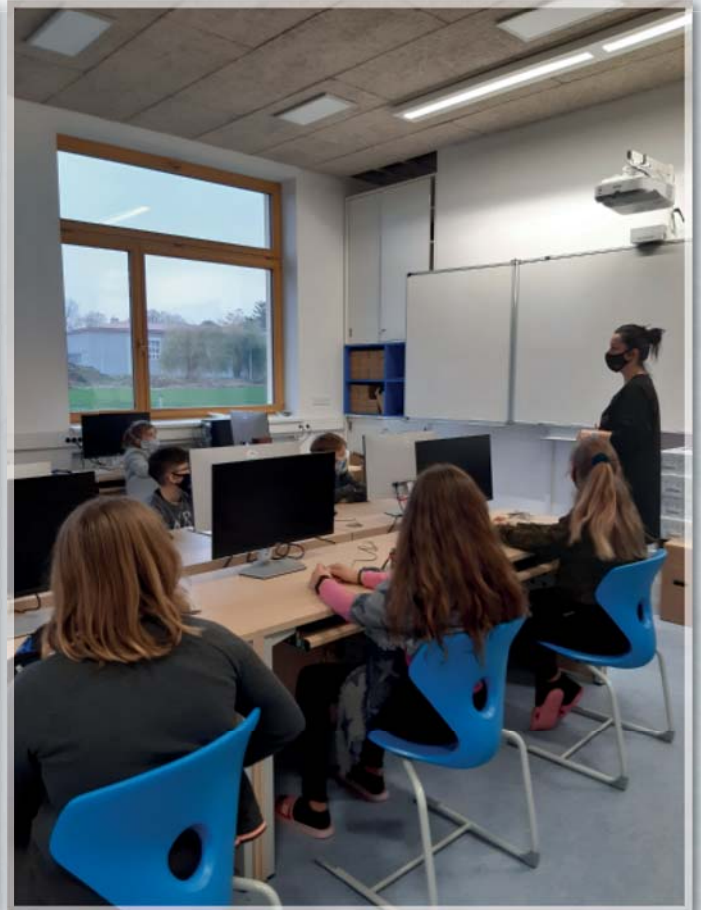
Nová počítačová učebna v přístavbě „měšťanky“