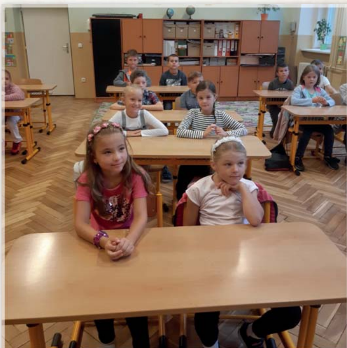
Zahájení školního roku