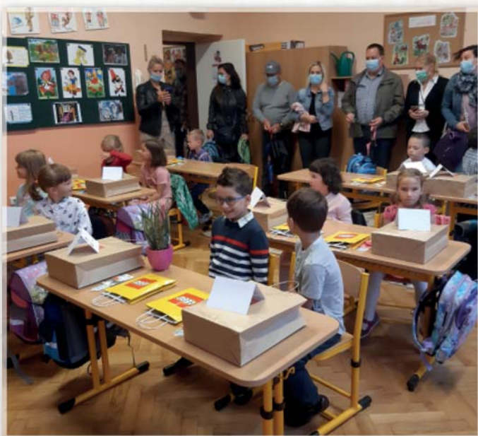
Prvníáci poprvé usedli do lavic