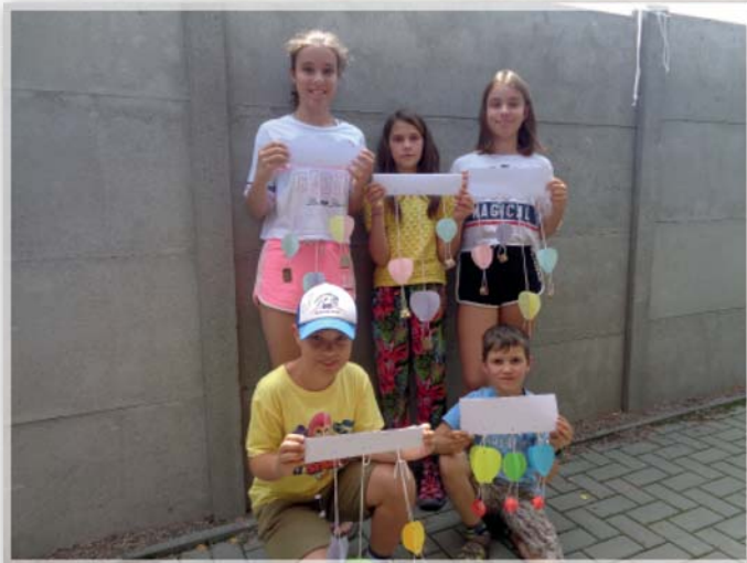
Letní dopoledne v knihovně