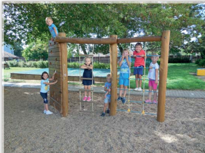
Děti v MŠ